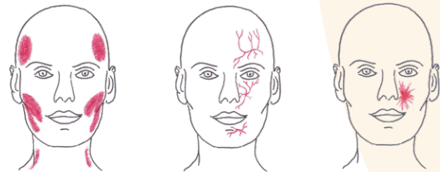
Abb.: Kiefer- und Gesichtsschmerzen haben verschiedene Ursachen.

Schmerzen in den Bereichen Gesicht, Kiefergelenke oder Mund sind häufige Beschwerden, weswegen sich Betroffene an ganz unterschiedliche Fachärzte wenden, zum Beispiel Zahnärzte, Hals-Nasen-Ohrenärzte, Kieferorthopäden, Neurologen oder Allgemeinmediziner. Ursachen für solche Schmerzen sind vor allem Entzündungen von Zähnen, Zahnhalteapparat, Knochen, Gelenken, Schleimhäuten, Nasennebenhöhlen oder Nerven im Kopf-Halsbereich. Auch Erkrankungen oder Verletzungen der Nerven, die diese Region mit Gefühl versorgen, können die Ursache für Schmerzen oder Taubheitsgefühle sein. Solche Schmerzen werden dann als „neuropathisch“ bezeichnet, was bedeutet, dass ein Nerv in irgendeiner Art geschädigt ist. Die Unterscheidung der Schmerzen nach deren Ursache kann nur durch eine sorgfältige körperliche Untersuchung getroffen werden und ist wichtig für die richtige Behandlung.