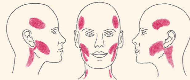
Abb.: Typischer Schmerzbereich bei Kaumuskel- und Kiefergelenkbeschwerden.

Merkmale: Typisch sind ein- oder beidseitige Schmerzen im Bereich der Wangen und/oder Schläfen, oftmals verbunden mit Nacken- oder weiteren Wirbelsäulenbeschwerden (s. Abb.). Diese Schmerzen können auch in die Zähne und/oder Ober- und Unterkiefer ausstrahlen, so dass sie schnell mit einer Erkrankung des Zahnes verwechselt werden können. Beim Abtasten der betroffenen Muskeln sind diese schmerzhaft, angespannt und verhärtet, möglicherweise auch verdickt. Häufig pressen diese Menschen unbewusst die Zähne, Zunge, Wangen und Lippen zusammen oder Knirschen mit den Zähnen (sogenannter Bruxismus), auch in der Nacht. Die Öffnung des Mundes kann erschwert sein.