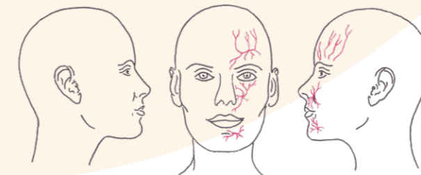
Abb.: Der Trigeminalnerv mit seinen drei Ästen.

Bei der Trigeminalneuropathie können die Schmerzen sowohl attackenförmig sein wie bei der Trigeminalneuralgie oder auch andauernd bestehen.